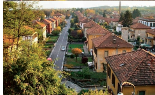
Una piantina del Villaggio Crespi d'Adda, il castello dei padroni, i corpi di fabbrica e le casette dei dipendenti